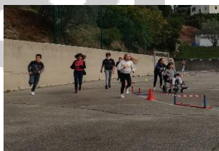
article (cliquez) collège Doche