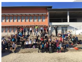
Article (cliquez) Collège V.Schoelcher